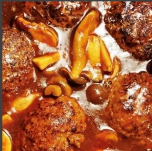
国産牛100% 煮込みハンバーグ