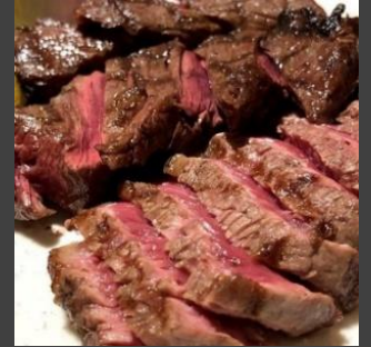
ビーフステーキ +500円

※写真はイメージです。 ※当日中にお召し上がり下さい。 ※使い捨て容器でお渡しいたします。 ※仕入れの状況により内容が変更になる場合がございます。