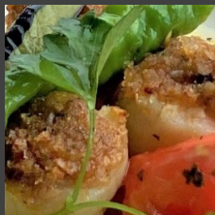
帆立貝柱 香草パン粉焼き