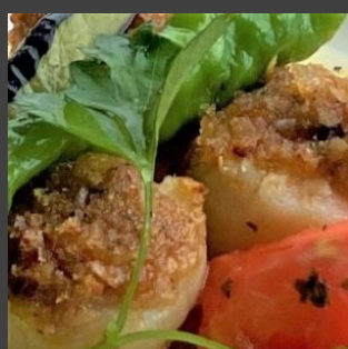
帆立貝柱 香草パン焼き