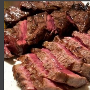
ビーフステーキ +500円

※写真はイメージです。 ※当日中にお召し上がり下さい。 ※使い捨て容器でお渡しいたします。 ※仕入れの状況により内容が変更になる場合がございます。