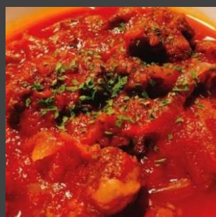
神奈川県産やまゆり ポークトマト煮