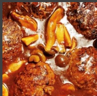
国産牛100% 煮込みハンバーグ